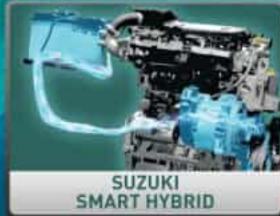
SUZUKI SMART HYBRID

Waktunya lakukan lebih banyak perjalanan yang tak terlupakan bersama keluarga dengan teknologi pintar yang lebih efisien.