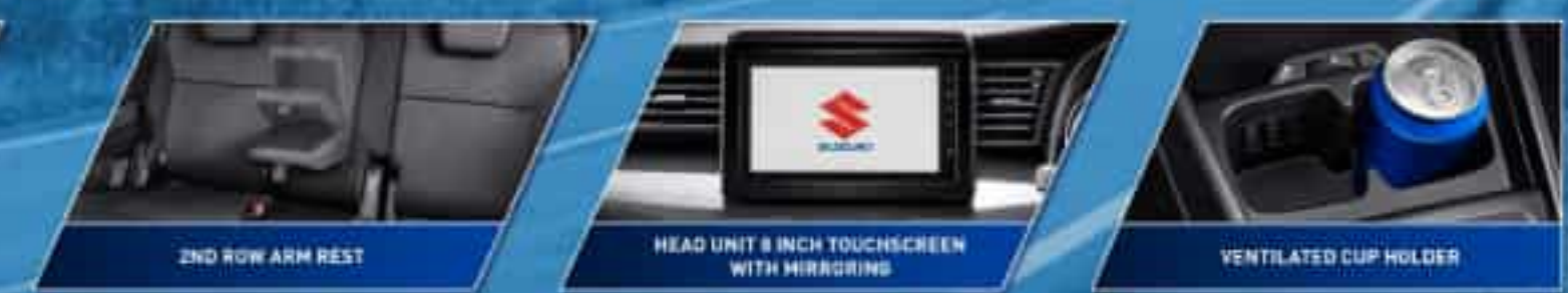
2ND ROW ARM REST