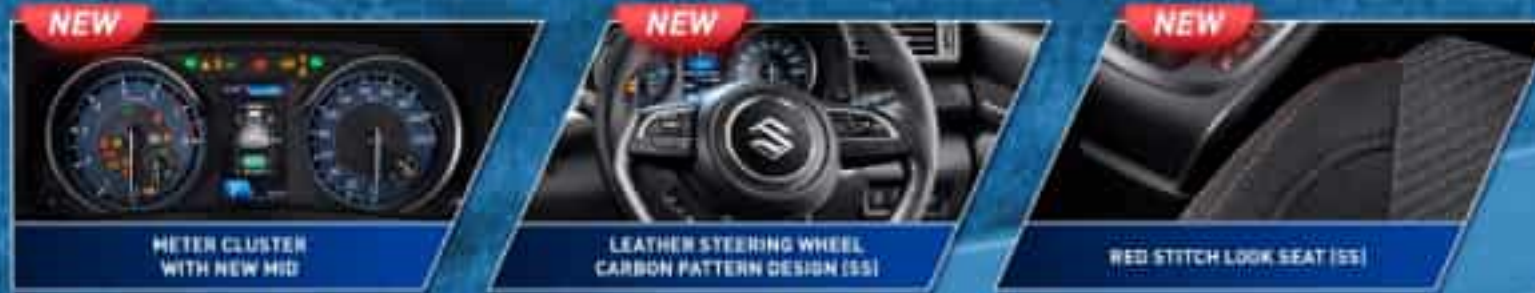
METER CLUSTER WITH NEW MID