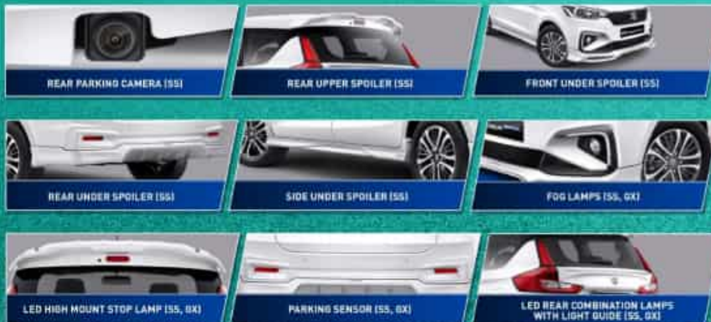
REAR PARKING CAMERA (SS)

All New Ertiga Hybrid hadir dengan tampilan baru yang modern sesuai perkembangan zaman. Sebuah mobil keluarga pintar dengan tampilan premium dan stylish, siap menjadi mobil Kebanggaan Keluarga.