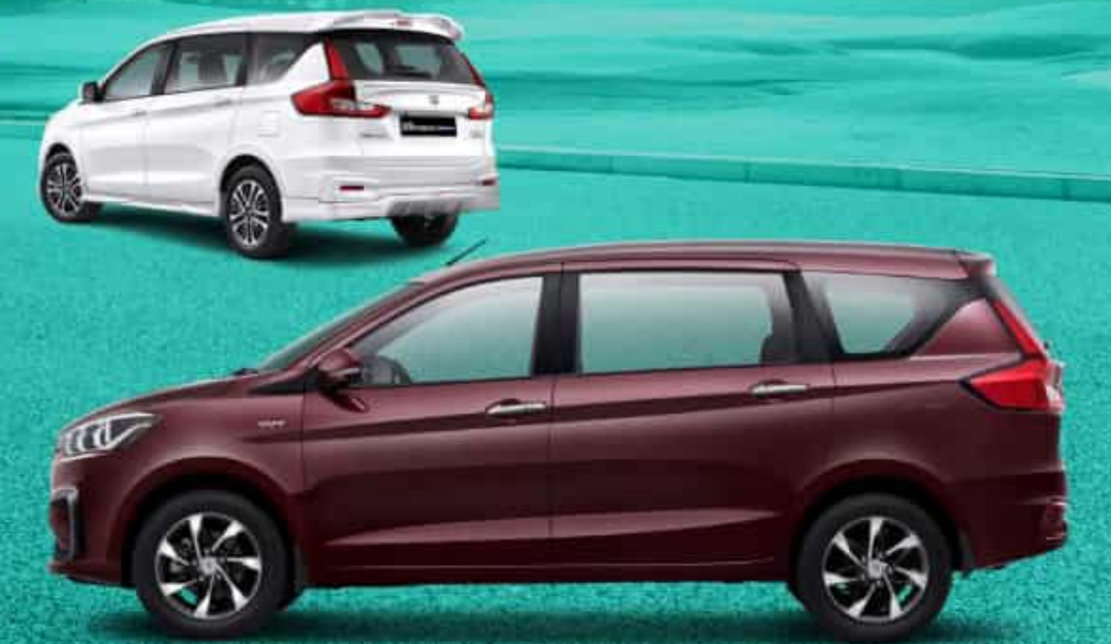
LED REAR COMBINATION LAMPS WITH LIGHT GUIDE (SS, GX)