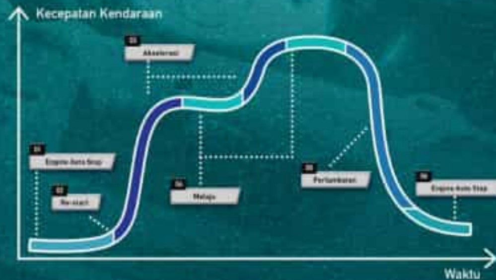
Lithium-ION (6 Ah 12 V) Garansi Lithium-ION battery selama 5 tahun atau 100.000 km